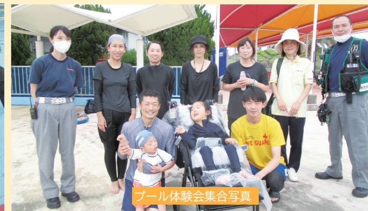
プール体験会集合写真