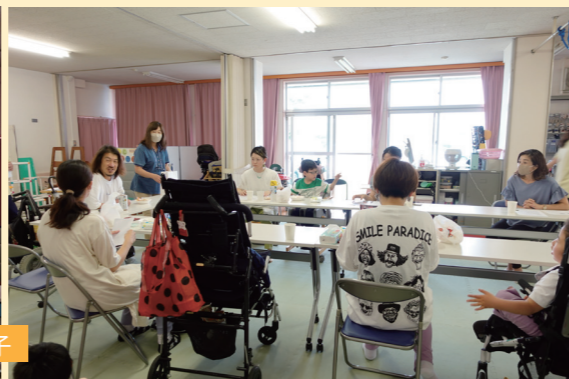
ふりかけプロジェクト茶話会の様子