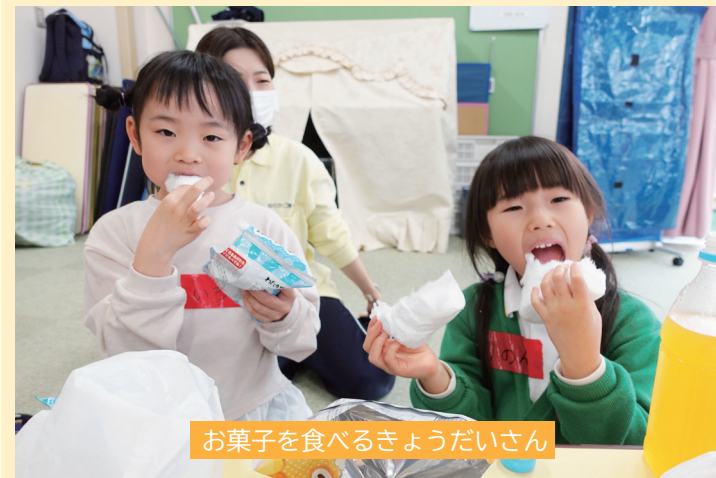
お菓子を食べるきょうだいさん

3月25日に第5回のお楽しみ会を開催しました。今回は低学年や就学前のごきょうだいを中心でした。ゆりかご園にある大きなトランポリンや、大きなセラピーボールに大喜び。お友だちと交代しながら遊んだり、お友だちの遊びと一緒に加わったり、職員と遊んだり、慣れてきたゆりかご園で思いきり遊ぶことができていたように思います。全体遊びでは、職員とじゃんけんをして勝つと進み、負けるとその場で待機、誰が1番にゴールできるか廊下全面を使って遊びました。上位3位には特別なお菓子のプレゼントで表彰式も行い、室内でも白熱した全体遊びの時間でした。